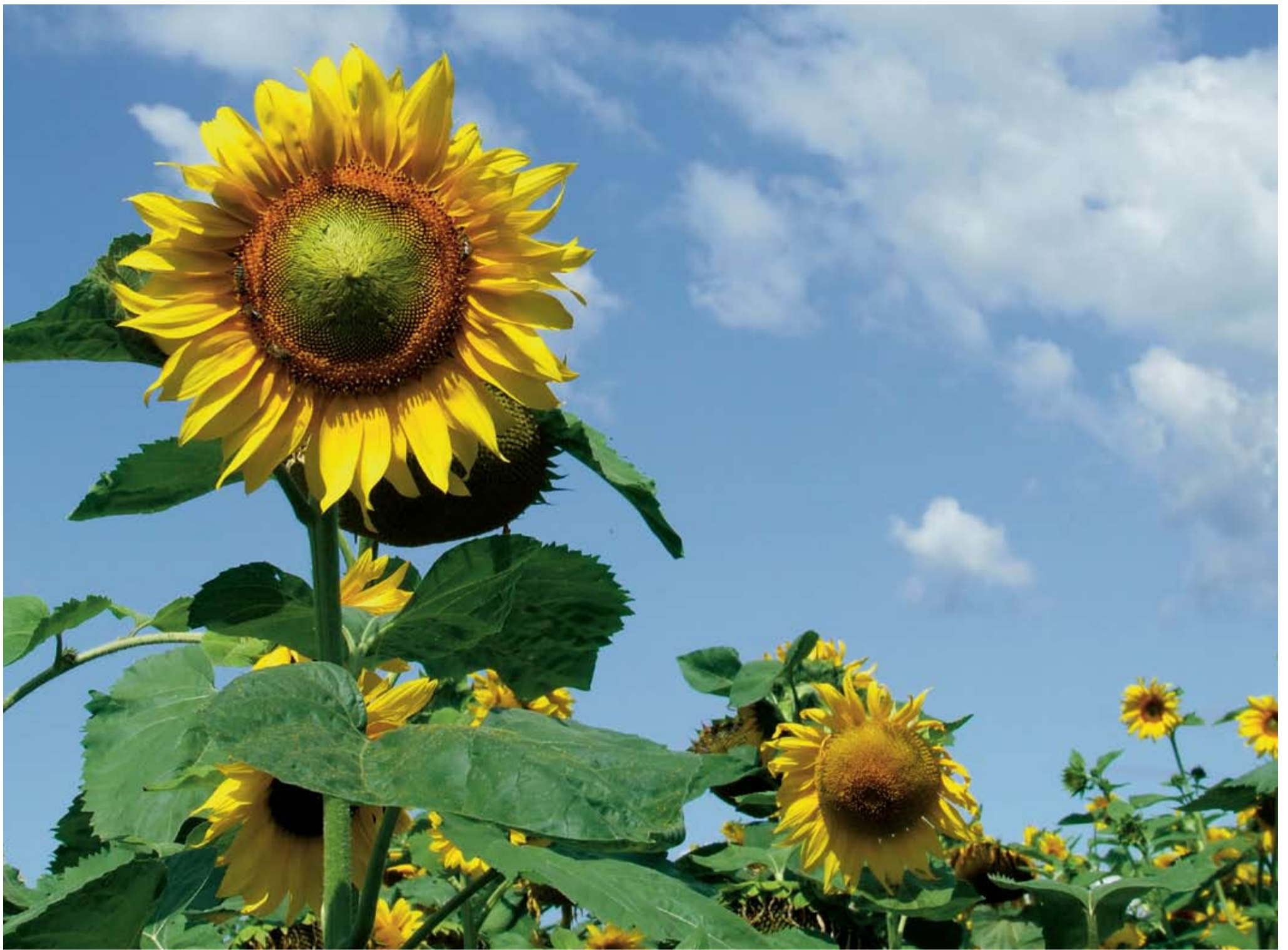
Fotó: Gerencsér Ibolya