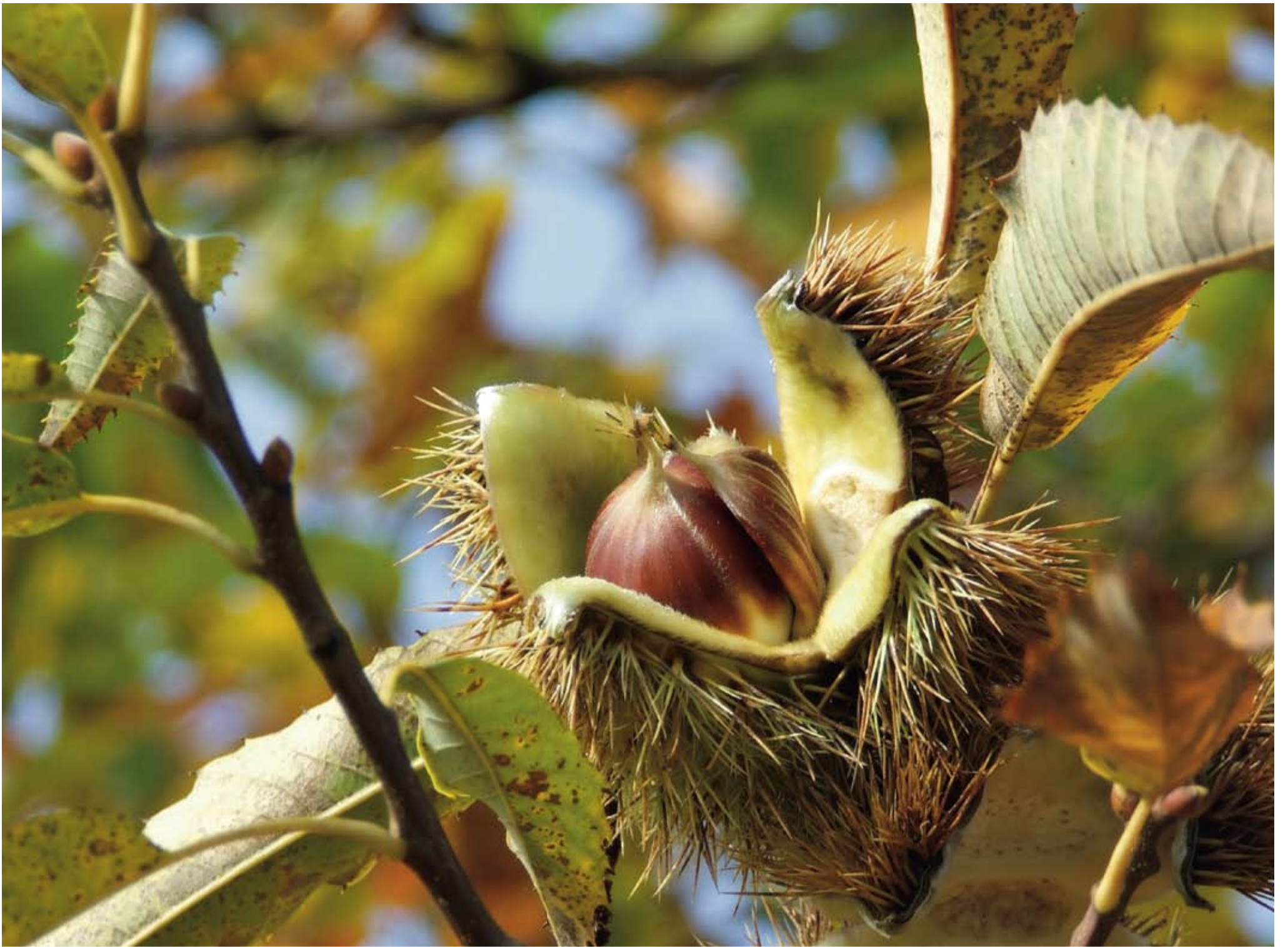
Fotó: Gerencsér Ibolya